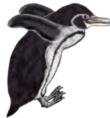
de las islas Galápagos