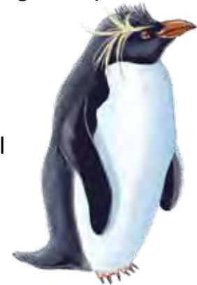
de Penacho Amarillo

Los pingüinos son aves. Sus alas se parecen a unas aletas pero el movimiento es igual al de otras aves volando en el aire. ¡Ellos "vuelan" a través del agua en lugar del aire!