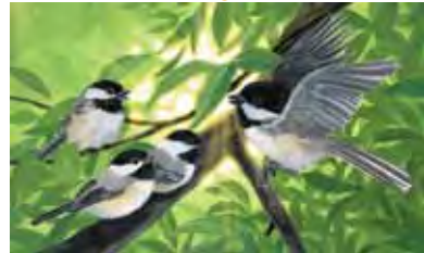
carboneros de gorra oscuros

Une el animal a su descripción. Luego, une los colores para identificar las clases de animales. ¿Cuáles animales son mamíferos , reptiles , aves , insectos o anfibios ?