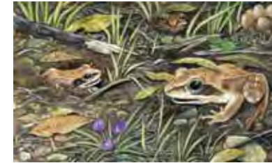
ranas de madera