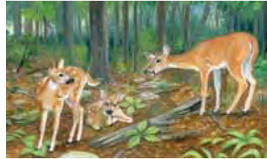
venados de cola blanca