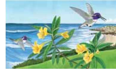
colibríes de Costa