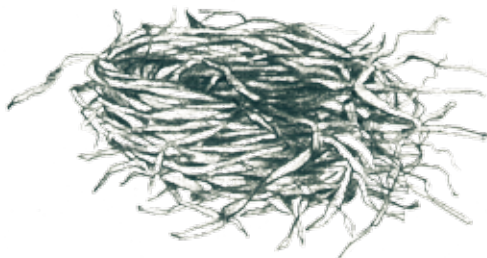
rastros de casas (nidos de pájaros, telarañas, etc.)