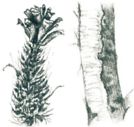
piñas, nueces o cortezas de árboles que están masticadas