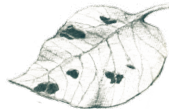
plantas que están rotas o masticadas