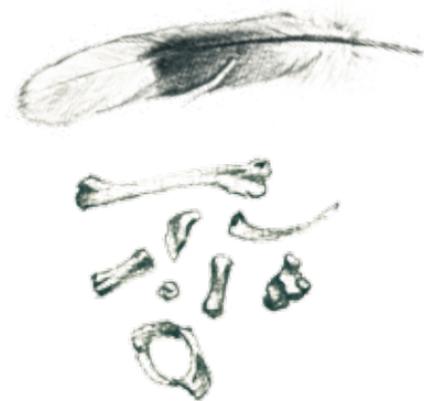
plumas, conchas, o huesos