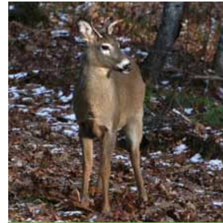
venado de cola blanca

Une las descripciones a la derecha con los animales a la izquierda. Las respuestas se encuentran al final de la página.