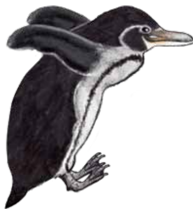
de las islas Galápagos

Una capa de grasa bajo las plumas también sirve como un aislante.