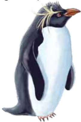
de Penacho Amarillo

Los pingüinos son aves. Sus alas se parecen a unas aletas pero el movimiento es igual al de otras aves volando en el aire. ¡Ellos “vuelan” a través del agua en lugar del aire!