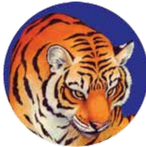
tigre: Panthera tigris