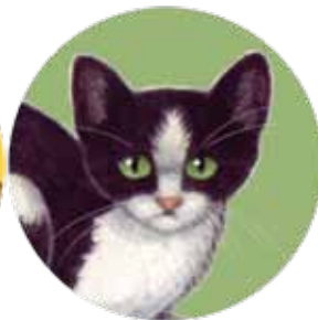
gato doméstico: Felis catus