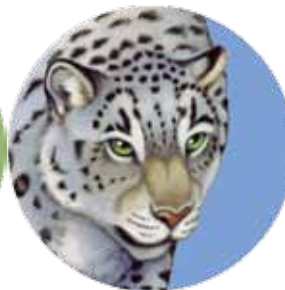
onza: Uncia uncia