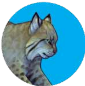
gato montés: Lynx rufus