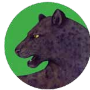
jaguar: Panthera onca