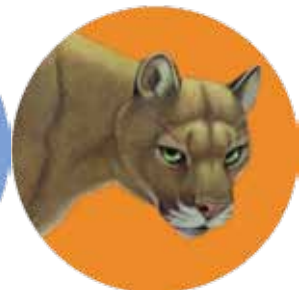
puma: Puma concolor