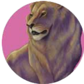
león: Panthera leo