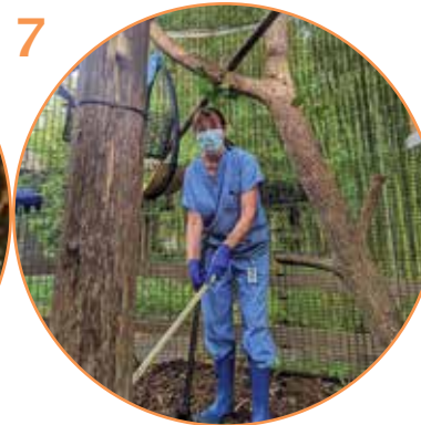
7 cuidador del zoológico