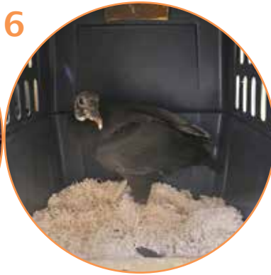
6 buitre pavo