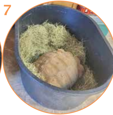
7 tortuga del desierto